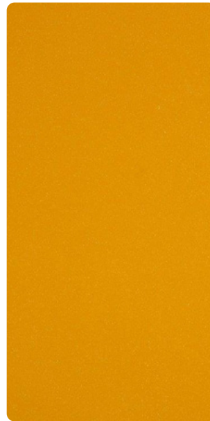
591TU14266R10 Masala Yellow