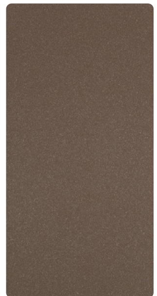
591TU79366R10 Natural Umber