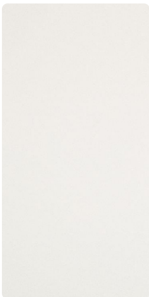
591TU14268R10 Limestone Rock