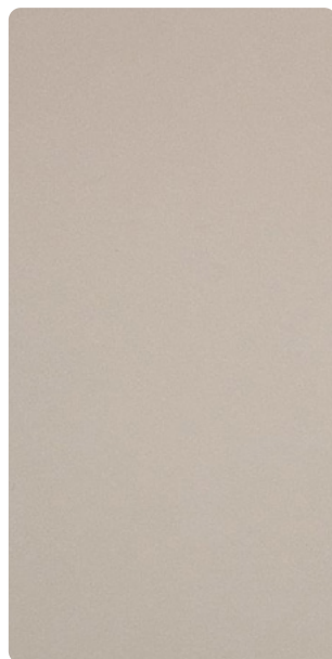
5907U79208S10 Pietra Mistica