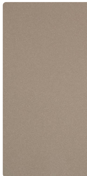
5903U79206S10 Sediment Grey