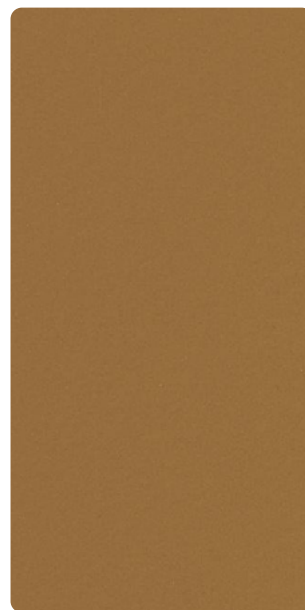
5903E14279S70 Desert Loam