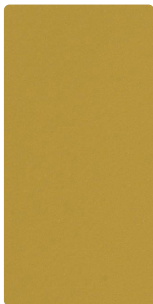
5903E13243S70 Golden Honey