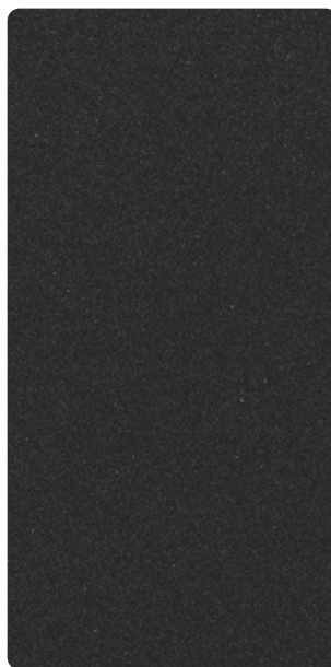
5903E71386S30 Ferrite Cube