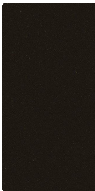
5903E81936S3F Dravit Cut