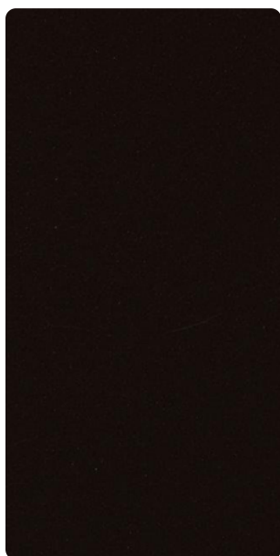
5903E82043S30 Mahagony Fame