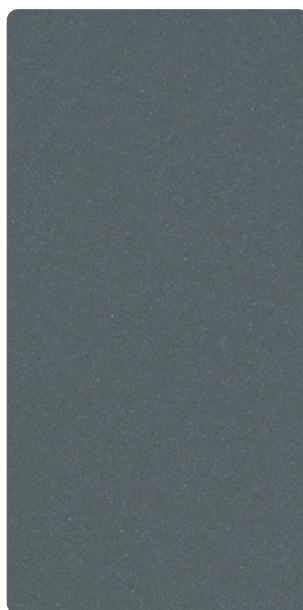
5903E71518S70 Frozen Needle