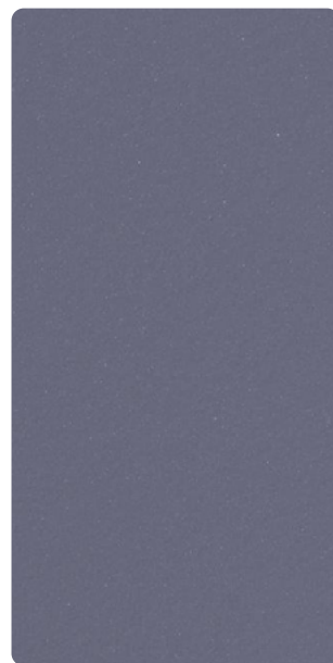
5903E53989S70 Western Crown