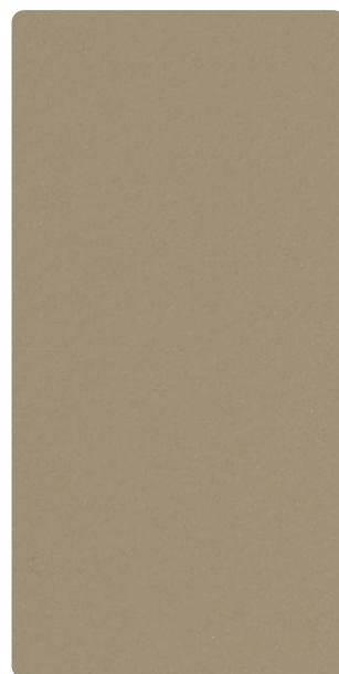
5903E83956S70 Hazel Wood