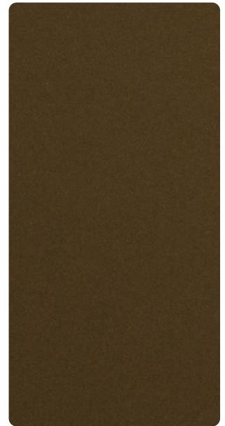
9503E82303A3F Ancient Bronze