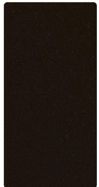
9503E84184A30 Vivid Soil