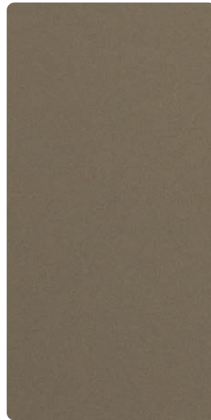
9503E82301A3F Silk Bronze