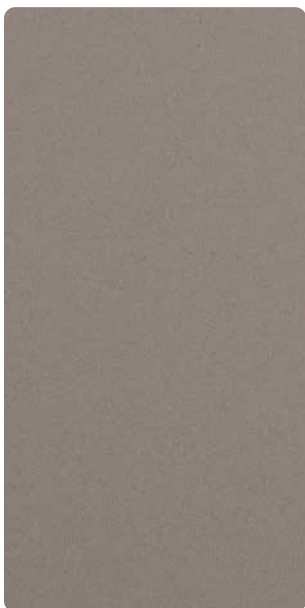
9503E7A523A30 Rock Viper